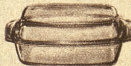
Fuente para asados y pescados