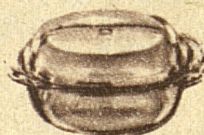
Fuente con tapadera reversible

De venta en los buenos establecimientos del ramo.