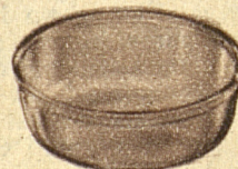
Nuevo molde (sólo para la parrilla y el horno)

VIDRIO JENA resistente al fuego - utilizable en cualquier hornillo, en juego con cualquier vajilla, económico, elegante y práctico - un regalo ideal